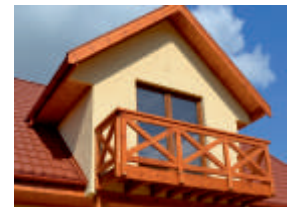
E130 - wariant A widok balkonu

98-160 Sędziejowice Marzenin Pl. Różany 5 tel. +48 603 95 00 00 tel. +48 601 34 93 94 e-mail: domy@dor-tex.pl www.dor-tex.pl