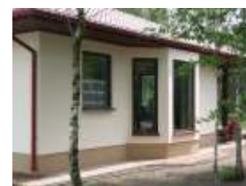
E1294 - wariant A elewacja boczna

Parterowy budynek zaprojektowany dla czteroosobowej rodziny. Na 107 m 2 powierzchni użytkowej udało się zmieścić dwie łazienki, spiżarnię i kotłownię na piec gazowy. W salonie widoczny wykusz oraz zadaszony taras.