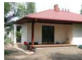
E1294 - wariant A elewacja ogrodowa