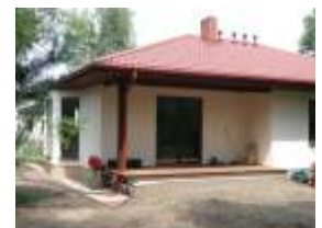
E1294 - wariant A elewacja ogrodowa

pow. zabudowy: 141,00 m 2 wys. bud.: 5,20 m kubatura: 391,00 m 3