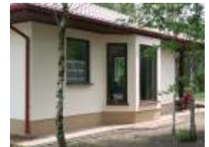
E1294 - wariant A elewacja boczna

Parterowy budynek zaprojektowany dla czteroosobowej rodziny. Na 107 m 2 powierzchni użytkowej udało się zmieścić dwie łazienki, spiżarnię i kotłownię na piec gazowy. W salonie widoczny wykuszt oraz zadaszony taras.