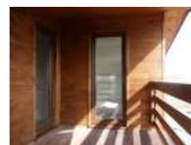
E128 - wariant A widok tarasu

98-160 Sędziejowice Marzenin Pl. Różany 5 tel. +48 603 95 00 00 tel. +48 601 34 93 94 e-mail: domy@dor-tex.pl www.dor-tex.pl