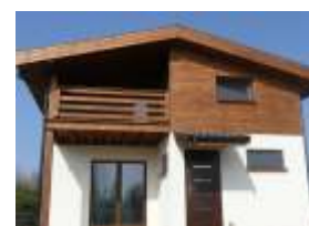
E128 - wariant A elewacja frontowa