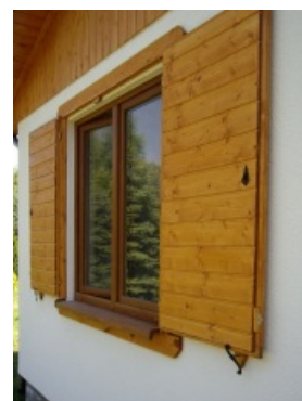
E125 - wariant A widok okiennic

więcej projektów na stronie www.dor-tex.pl