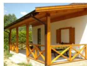
E125 - wariant A elewacja ogrodowa

Parterowy dom kryty dachem dwuspadowym, ogromnym plusem tego projektu jest obszerny, zadaszony taras.