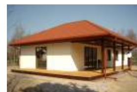
E119 - wariant A elewacja ogrodowa