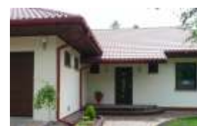
E119 - wariant A elewacja frontowa

98-160 Sędziejowice Marzenin Pl. Różany 5 tel. +48 603 95 00 00 tel. +48 601 34 93 94 e-mail: domy@dor-tex.pl www.dor-tex.pl