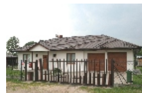
E117 - wariant A elewacja frontowa

Parterowy dom kryty dachem kopertowym. Garaż na dwa samochody.