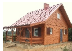
E111 - wariant A elewacja frontowa

98-160 Sędziejowice Marzenin Pl. Różany 5 tel. +48 603 95 00 00 tel. +48 601 34 93 94 e-mail: domy@dor-tex.pl www.dor-tex.pl