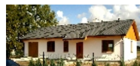
E109 - wariant C elewacja frontowa

98-160 Sędziejowice Marzenin Pl. Różany 5 tel. +48 603 95 00 00 tel. +48 601 34 93 94 e-mail: domy@dor-tex.pl www.dor-tex.pl