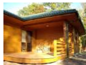
E107 - wariant B widok tarasu