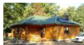
E107 - wariant B elewacja ogrodowa

98-160 Sędziejowice Marzenin Pl. Różany 5 tel. +48 603 95 00 00 tel. +48 601 34 93 94 e-mail: domy@dor-tex.pl www.dor-tex.pl