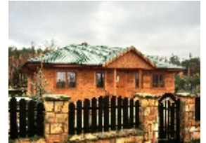
E106 - wariant D elewacja frontowa

98-160 Sędziejowice Marzenin Pl. Różany 5 tel. +48 603 95 00 00 tel. +48 601 34 93 94 e-mail: domy@dor-tex.pl www.dor-tex.pl