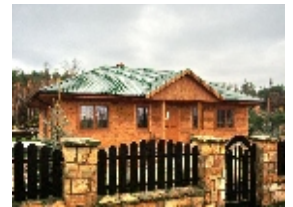
E106 - wariant D elewacja frontowa

98-160 Sędziejowice Marzenin Pl. Różany 5 tel. +48 603 95 00 00 tel. +48 601 34 93 94 e-mail: domy@dor-tex.pl www.dor-tex.pl