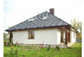
E105 - wariant A elewacja boczna

98-160 Sędziejowice Marzenin Pl. Różany 5 tel. +48 603 95 00 00 tel. +48 601 34 93 94 e-mail: domy@dor-tex.pl www.dor-tex.pl