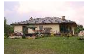
E103- wariant A elewacja ogrodowa

Parterowy dom dwurodzinny zaprojektowany indywidualnie dla naszego Klienta. Na elewacji ogrodowej przestronny taras z podłogą wykonaną z deski ryflowanej.