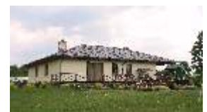
E103 - wariant A widok tarasu

pow. zabudowy: 245,00 m 2 wys. bud.: 5,20 m kubatura: 506,00 m 3