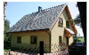
E102 - wariant D elewacja frontowa

98-160 Sędziejowice Marzenin Pl. Różany 5 tel. +48 603 95 00 00 tel. +48 601 34 93 94 e-mail: domy@dor-tex.pl www.dor-tex.pl