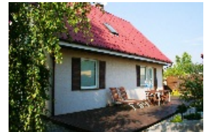
E102 - wariant C elewacja ogrodowa

98-160 Sędziejowice Marzenin Pl. Różany 5 tel. +48 603 95 00 00 tel. +48 601 34 93 94 e-mail: domy@dor-tex.pl www.dor-tex.pl